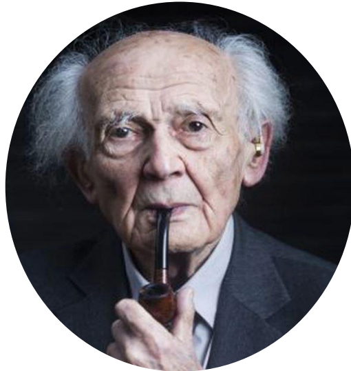
Bauman, Zygmund (2003) Modernidad líquida, FCE, Buenos Aires. Prólogo y Cap.2, pp. 7-20; 59-97.