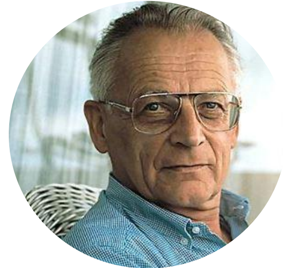
Touraine, Alain (1994) Crítica de la modernidad, CE, Buenos Aires, Cap.9, pp. 201-230.