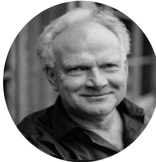
Beck, Ulrich (1998) La sociedad del riesgo. Hacia una nueva modernidad, Paidós, Barcelona, Cap.1, pp. 25-56.